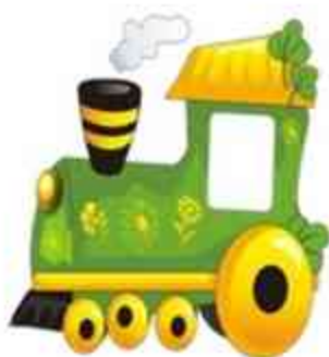
Поезд. Машинист. Вагоны